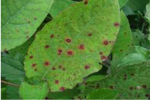
Slika 4: Vijoli ne pege na listih japonskega dresnika na obrežju Save Dolinke pred Bledom

pri nas domorodna in se predvsem rada pojavlja ob rekah, kjer se hrani z obrežnim rastlinstvom. Omenjeni polži so liste japonskega dresnika objedali le na spodnji tretjini grmov, a je bila njihova številnost premajhna, da bi uspeli zadržati sicer bujno rast tega plevela.