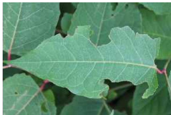
Slika 3: List japonskega dresnika na obrežju Save v Krškem, objeden od neznanih grizilnih organizmov

Najzanimivejšo najdbo brez dvoma predstavljajo polži iz lokacije Zg. Log, katerih analiza je pokazala, da gre za vrsto Succinea putris (L.) (Gastropoda: Stylomatophora) (slika 2), ki je