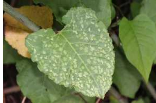
Slika 5: List japonskega dresnika iz Rožne doline v Ljubljani, ki kaže simptome okužbe z virusi