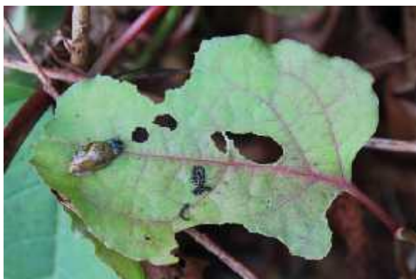
Slika 2: Polž Succinea putris na objedenem listu japonskega dresnika v Zgornjem Logu pri Litiji na obrežju Save

Na večini vzorčnih mest na japonskem dresniku nismo ugotovili izrazitih poškodb ali simptomov bolezni, na več lokacijah po vsej državi pa smo na listih opazili drobne vijolične pege (ki niso bile povezane s pospešenim rumenenjem listov) (slika 4), na katerih pa nismo našli povzročitelja bolezni in so verjetno odraz delovanja kakšnega od abiotičnih dejavnikov. Izpostaviti velja tudi najdba dresnika z značilnimi belimi pegami na listih (slika 5) (maj, Rožna dolina v Ljubljani), v katerih pa z elektronsko mikroskopijo ni bilo dokazanih virusov ali viroidov.